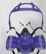
Dräger X-plore 3500