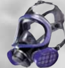
Dräger X-plore 5500

Dräger X-plore 3300: une alternative à un prix avantageux qui exige peu d'entretien. Le bon choix pour tous ceux qui ont besoin d'un masque confortable et peu onéreux.